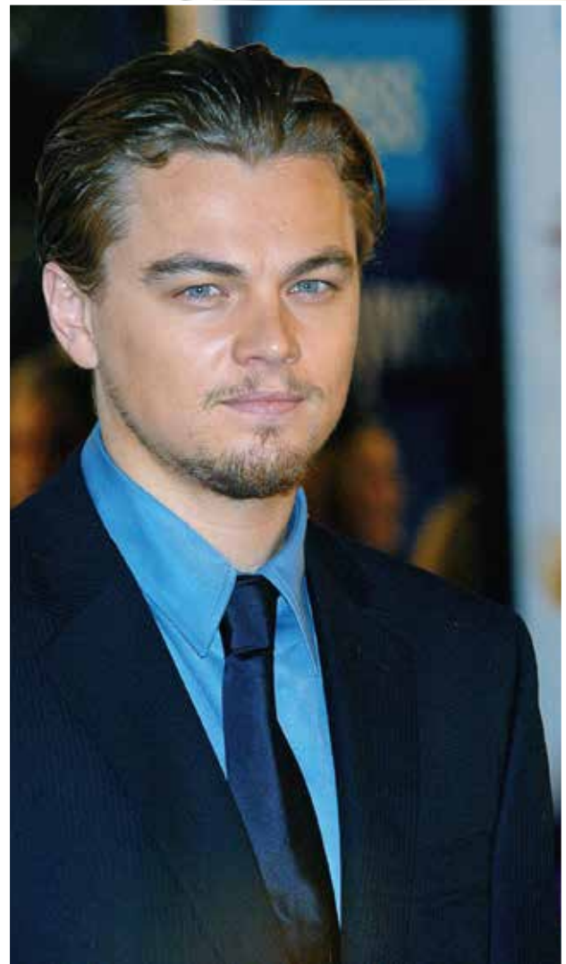
Leonardo DiCaprio verkörpert Frank Abagnale in dem Hollywoodstreifen „Catch me if you can“ Leonardo DiCaprio portrays Frank Abagnale in the Hollywood movie „Catch me if you can“