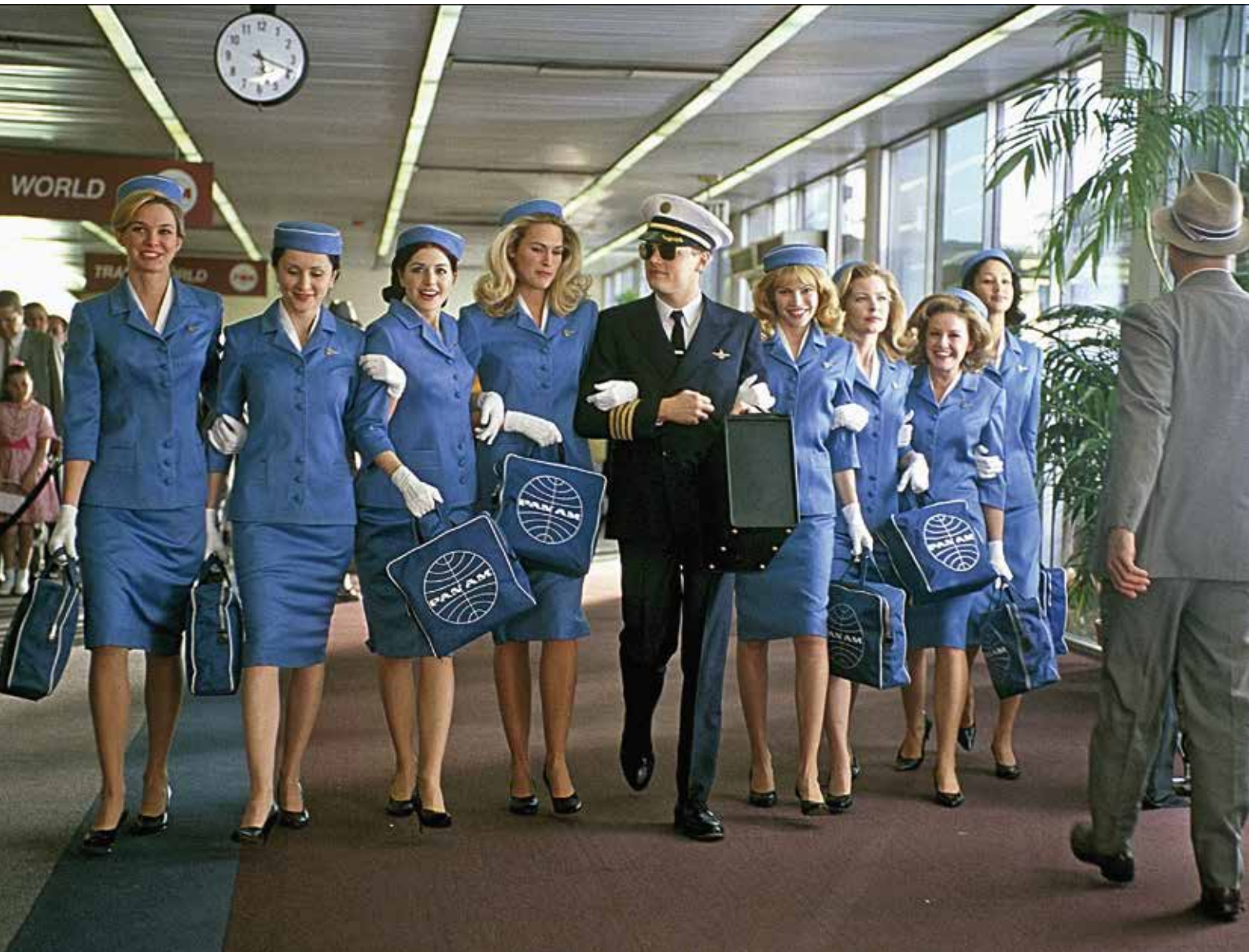
Eine der berühmtesten Szenen des Hollywoodstreifens „Catch me if you can“: Leonardo DiCaprio als Frank Abagnale in seiner Identität als Pilot One of the most famous scenes from the Hollywood movie “Catch me if you can“: Leonardo DiCaprio as Frank Abagnale in his identity as a pilot