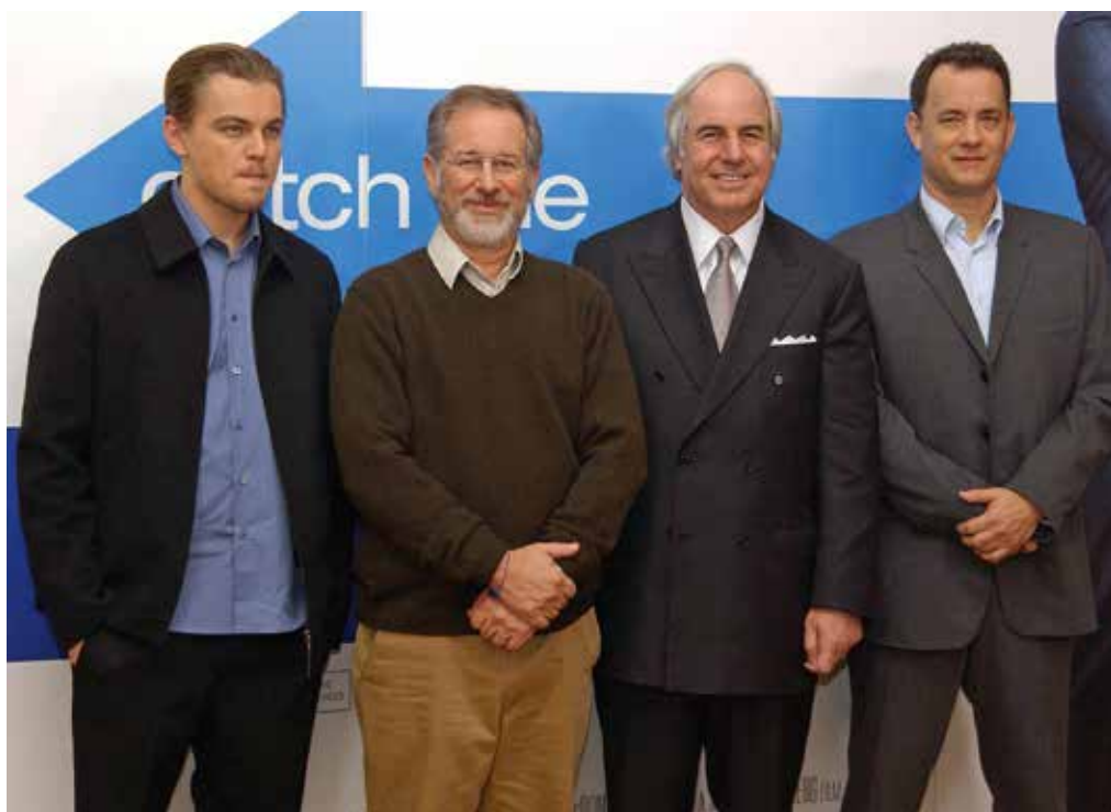
Leonardo DiCaprio, Steven Spielberg, Frank Abagnale & Tom Hanks (v.l.) bei der Filmpremiere des Hollywoodstreifens „Catch me if you can“ | Leonardo DiCaprio, Steven Spielberg, Frank Abagnale & Tom Hanks (from the left) at the film premiere of the Hollywood movie "Catch me if you can"

What advice would you give your children and younger generations with regard to identity theft, never giving up and helping others?